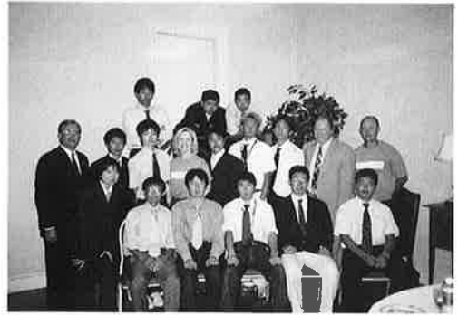
写真3 終了記念写真

さいました。私も学生も、先生の心遣いに変え感激しました。日本人の私たちは、逆に先生から日本の心を学ぶことができました。