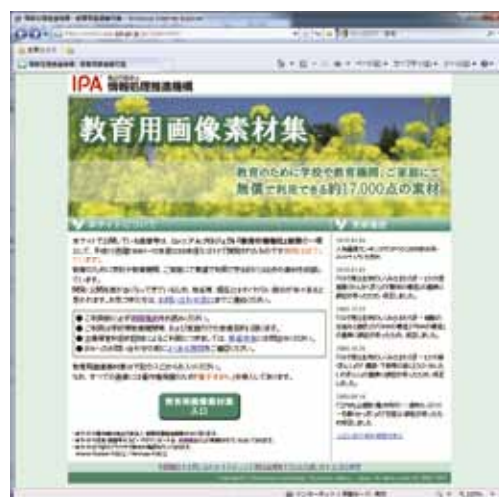
図6 IPAの教育用画像素材集のサイト