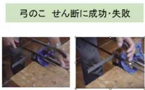
図2 成功例と失敗例とを同時上映

図2はその典型的な例である。左側は金属片のせん断に成功した事例、右側は糸鋸（のこ）の刃が作業中にかけてしまった失敗例である。生徒が理解するまで何度でもこれは同時上映を反復できるので、反復の間に失敗の原因を聞いたりヒントを与えたりすれば、容易に生徒は出来事のからくりを理解できると考えられる。