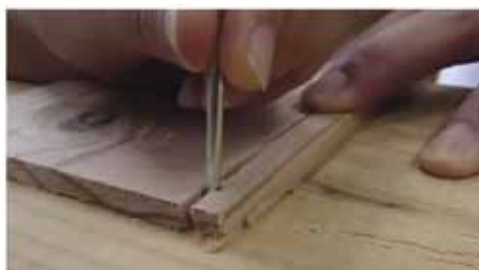
図1 釘打ちで板が割れる事例の動画

さまざまな方法で学習者に動機付けを与えることが出来るが、たとえば木材加工のような学習内容の場合、失敗例が生徒の側にさまざまな示唆を与えることが可能であろう。生徒の側に「なぜ失敗したのか」という疑問が起こったら、授業は半ば成功したということもあろう。