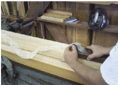
図3 かんながけの動画

このような動画の利点を再確認しておけば、単に二次元の画像では得られない教材作成が可能となるであろう。つまり作業の連続動作や継起の事象の呈示は二次元では困難なことが第一。しかも同時上映で細かい相違点を浮き彫りにすることも挙げられよう。さらに映像拡大で細かい作業や微小事象をイメージ豊かに提示することも可能であろう。