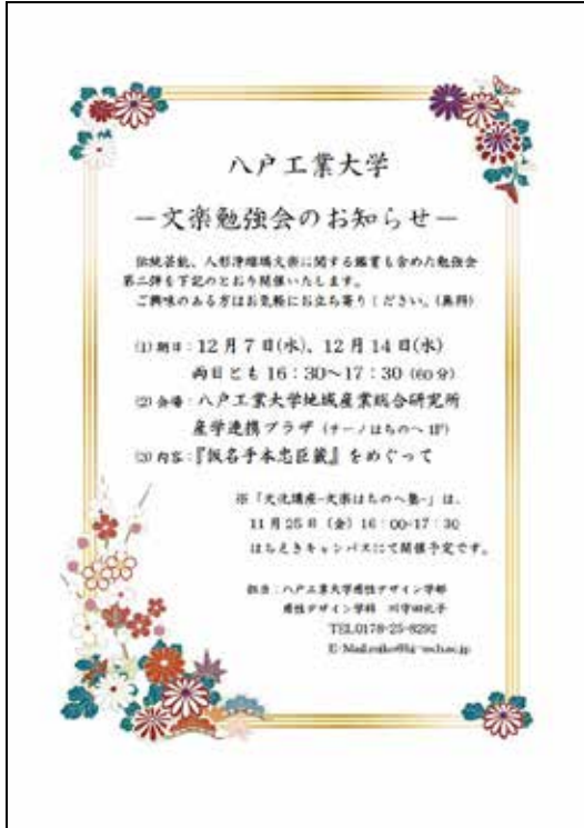
図4 文楽勉強会チラシ