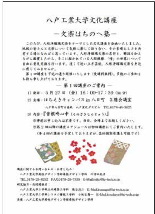
図1 文楽はちのへ塾講座チラシ