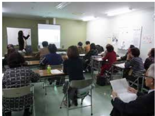
写真3 第3回講座の様子

前回講座までの要望等を受け、まずは人形浄瑠璃文楽の芸を体感してもらうことを優先した時間配分とした。鑑賞前の解説は簡潔にし、鑑賞時間を十分に確保し、鑑賞後に語句解説や補足説明を行ったが、初心者には文言や物語の展開に分かりにくい点があったようである。原文テキストや現代語訳本を一部参照して作品解釈を行ったが、今後は文字資料の有効活用など、分かりやすさへの工夫をさらに進めたい。