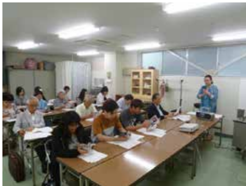
写真2 第2回講座の様子