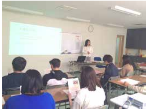
写真1 第1回講座の様子

ことであった。世話物作品はやはり受け入れやすかったようで、特に女子学生からの反響が多かった。しかし、作品解釈に関する情報提供のボリュームがやや大きく、初めて人形浄瑠璃文楽に接した受講者の疑問や新鮮な発見を吸収・共有する時間を設けるべきだったのが反省点である。