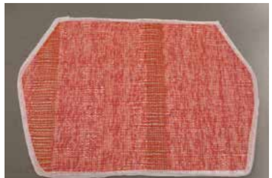
写真3 織り上げた裂織生地(ブラジャー用)

写真4は、完成したブラジャーとショーツのセットである。裂織の緯糸に使用した浴衣生地をリボン状に加工し、ブラジャーの肩紐部分とショーツの紐部分に配して着用時のアクセントとした。下着の伸縮部分にはなるべく裂織を縫い