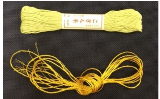
写真6 刺し子糸（上）・刺繍糸（下）