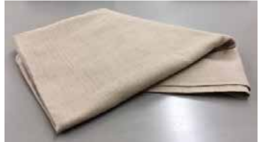
写真5 木綿コングレス生地

が多く細かい個所に菱模様を用いるのは難しいため、単純な刺しを用いた。この図案に基づき刺し作業を行った。写真8は完成作品である。