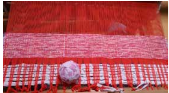
写真2 木綿浴衣地の織り作業