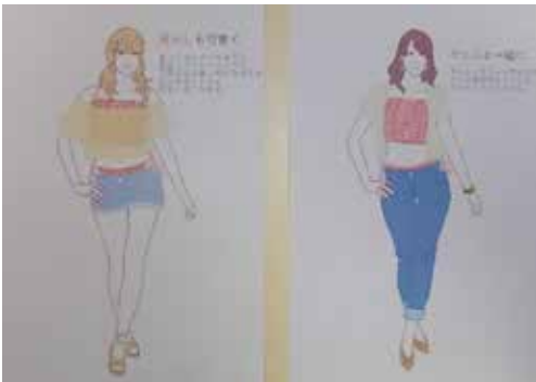
図4 コーディネートイラスト