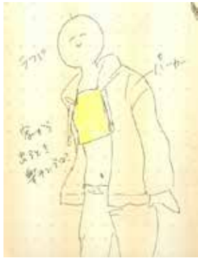
図1 ブラジャー装着

既存の下着を土台とし、それに「南部裂織」で製作した生地パーツを縫い付ける形とした。下着のサイズは標準体型の寸法に合わせ、下着の土台と裂織生地を組み合わせパターンを数種考案し(図3)、これに基づいて製作する裂織生地のサイズを確定した。