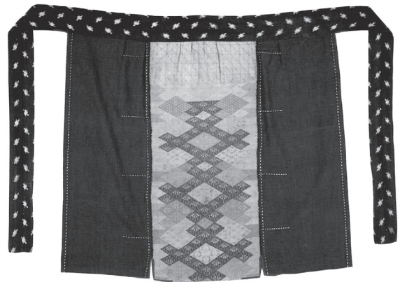
写真1 菱前掛け (田中忠三郎蔵) 2)

まず、青森県史編さん文化財部会による青森県の染織工芸調査が1996年から約10年間実施され、成果が『青森県史文化財編 美術工芸』にまとめられているほか、調査にあたった濱田淑子の論文等に詳しく記載されている。これにより歴史や発達経緯、分布や地域差、技法の特色や服飾展開、保存収集や継承活動など南部菱刺しの概要を知ることができる。昭和以降の保存収集・継承活動に尽力した人物として、八戸郷土研究会を創立した小井川潤次郎、民俗研究家の田中忠三郎、民藝運動関連の湯浅八郎・相馬貞三・濱田喜四郎・山村精、小川原湖博物館関連の渋沢敬三・杉本行雄・中道等らの名が挙げられている。また、復興を支えた製作者として、西野こよ、故松岡加恵、川村芳枝、八田愛子、鈴木堯子の名が挙げられている。このうち、八田愛子、鈴木堯子は、ともに県外出身者で夫の転勤等で八戸に滞在した間に復興・製作活動に携わり、『菱刺し模様集』および『新技法シリーズ 菱刺しの技法』の2冊を出版した。これらの書籍は現在絶版により入手困難だが、特に『菱刺し模様集』と田中忠三郎著『南部つづれ菱刺し模様集』(写真3)は、南部菱刺し模様を網羅的に集録した文献が他にないため