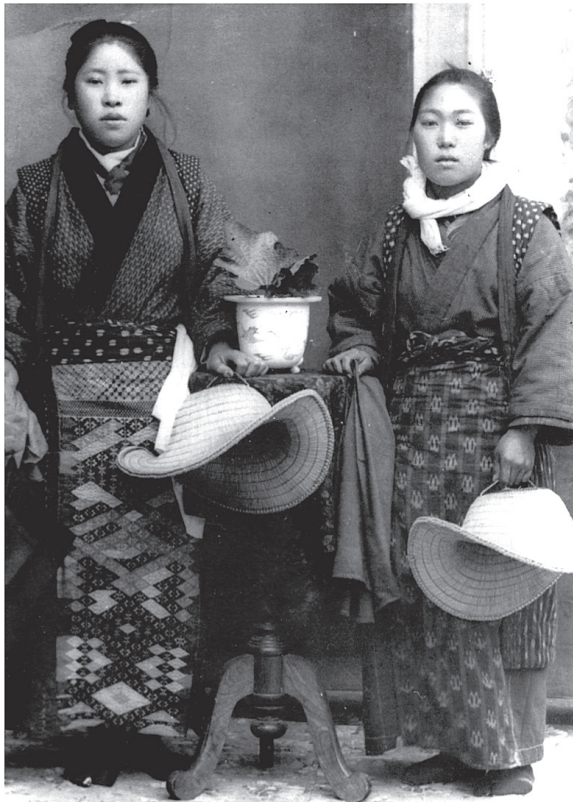
写真2 菱前掛けの娘 3)

東北地方の刺し子の総合的研究としては、徳永幾久『刺し子の研究』、山本 昭子・山田 いずみ「東北地方の刺し子の研究」などが詳しい。前者は、山形県の刺し子を中心に、刺し子文化の徹底した悉皆調査の成果をまとめた、膨大な質量の論考である。民俗服飾、衣生活史という観点から、刺し子文化の背景に横たわる衣料窮乏の農民生活に関する記述が詳細で参考になる。後者は、東北地方六県の刺し子や文献の調査収集に基づき、模様形態、技術、歴史的地理的背景といった総合的見地から検討を行っている。他にも、刺し子の美の特性や模様特性などデザイン学的アプローチによる研究も始まっている。