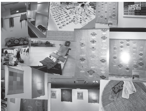
写真13 菱刺し展の様子