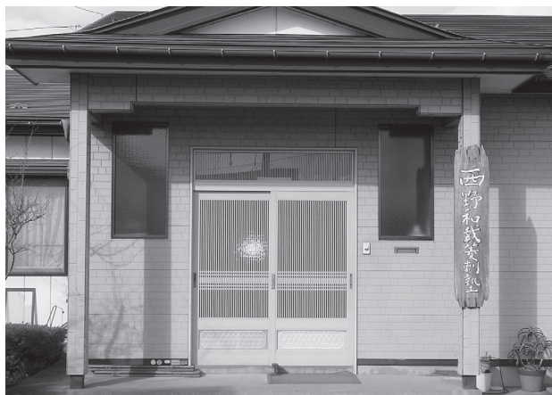
写真4 西野和裁菱刺塾