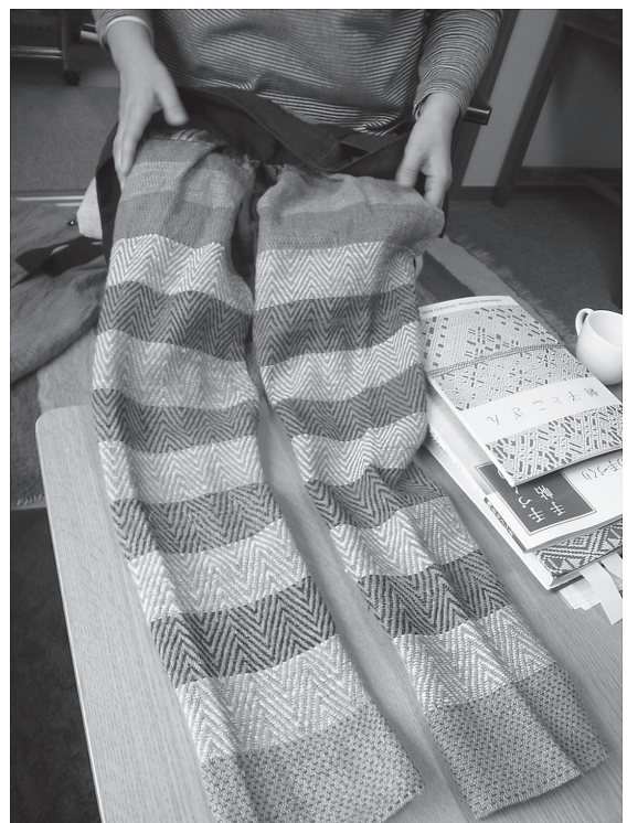
写真14 菱刺しの股引