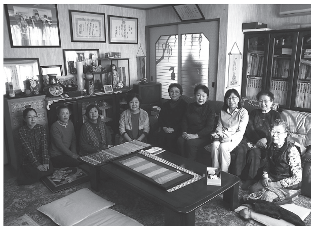
写真5 西野刺っ娘の会会員

では、以下に調査の結果をまとめる。図2に会員8名の住まい、出身地、年代、製作歴の内訳を示した。全員女性で、年代は熟年層が多い。半分が10年以上の経験者である。