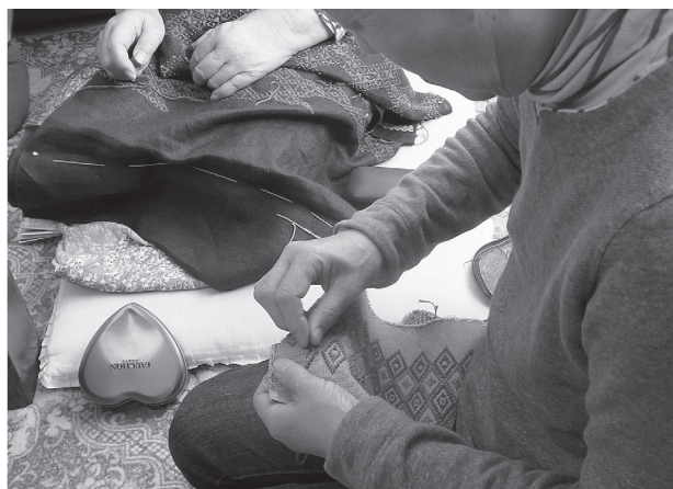
写真6 教室での作業風景