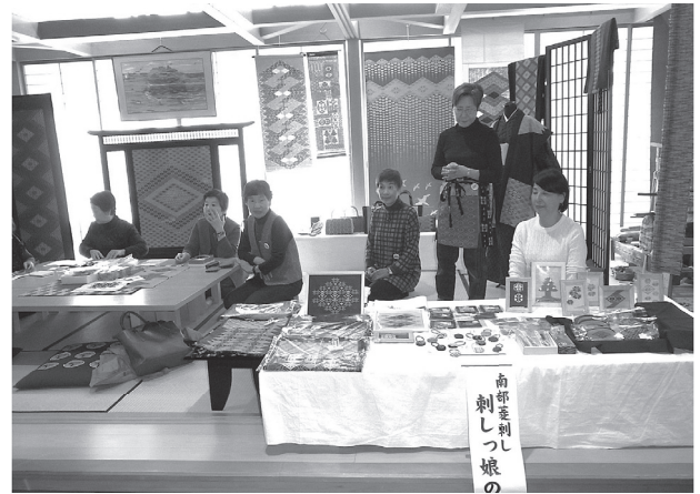
写真9 はっち市出展

他の製作者や他団体とは、イベントの見学や個別の情報収集程度で、密接な交流、定期的な交流はあまりないようである。菱刺し製作の可能性を広げるため今後は積極的に交流を図りたい(4名)という意見があった。