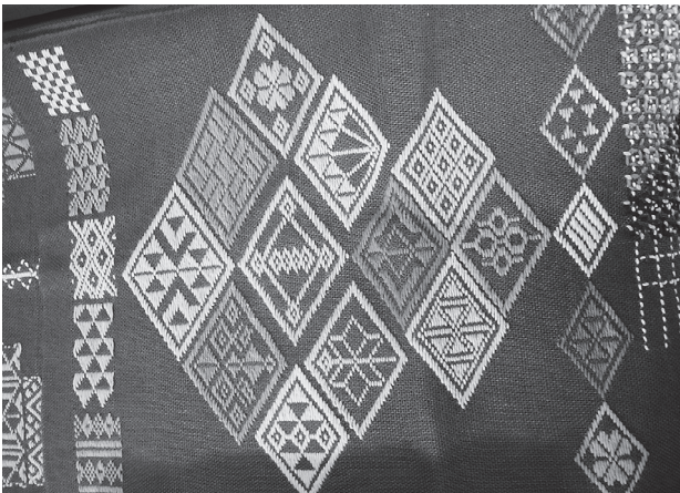
写真12 基本刺しの見本