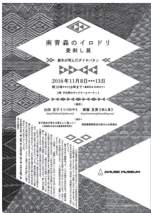
図3 東京での菱刺し展

反面、南部菱刺しの工芸品としての今後を考えるうえでの問題点も浮き彫りになってきた。一般的な認知度の低さ、後継者不足、手間と製品価格の釣り合い、振興を支える地元の体制づくりの必要性など多くの課題が挙げられる。また、製作者同士の交流も十分ではなく、地域ブランドとしての結束力向上につながるネットワークづくりが今後必要かもしれない。ただし、製作者の一人が「菱刺しは内向する」と語ったように、刺すという作業自体に個の世界に没入せざるをえない性質があるという点も見逃せない。これは刺し手に癒しをもたらす南部菱刺しの特徴でもあるのだが、製作現場に閉鎖的な空気を