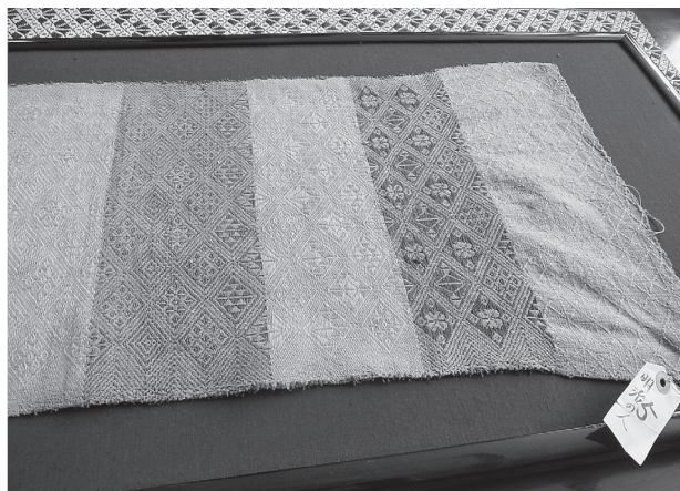
写真7 明治時代の菱刺し