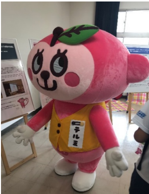
写真2 テルミちゃんになる

チラシは写真3のように感性デザイン学科1年(現創生デザイン学科2年)の学生が作成した。クイズ形式で興味関心がわくように内容を工夫していたが、A4版で大きいためか、なかなか受け取ってもらえず、若者や子どもの興味関心に合った広報啓発活動について課題が残った。