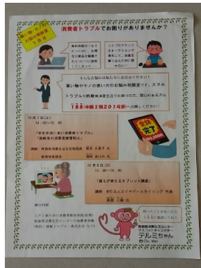
写真3 作成したチラシ