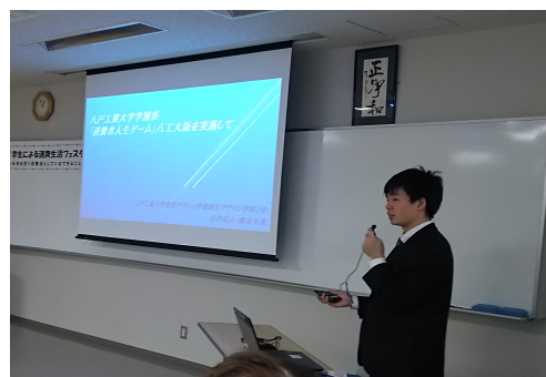
写真14 大学実践報告

ゲームの体験者に実施したアンケートによると、「満足できたか」は、学生満足度は満足44%やや満足54%であった。「消費者教育を学べたか」の内容は、詐欺被害、消費期限、悪質商法、保険、契約などにわたっていた。