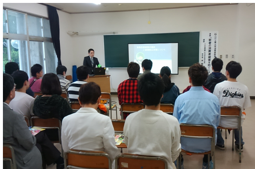
写真13 八戸警察署の講演

本学においても消費者被害に遭いそうになり、消費生活センターや警察署に相談する事例が発生している。聴講した学生の代表には、周囲の友人や後輩たちにも紹介事例や被害防止対策など消費生活情報を伝えてほしいと要望した。