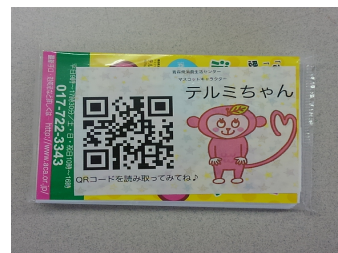
写真12 QRコードを記載

また、広報啓発のため、NPO法人青森県消費者協会から提供いただいた景品のうち、写真12のようにティッシュペーパーには青森県消費生活センターのQRコードをつけた紙を挿入し配布したところ、受け取った来場者は昨年より増えた。