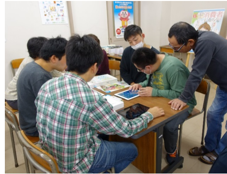
写真4 視覚障がい者の方と学ぶ

高度情報社会となり情報機器に関する新たな知識や技能が必要となっているが、熟達者と不慣れな人々との間で情報格差が問題となっている。実際、熟達している視覚障がい者の技能参観を通して、学生自身が弱者に役立つ機能の知識や技能を習得していないと支援は難しいことが窺われた。