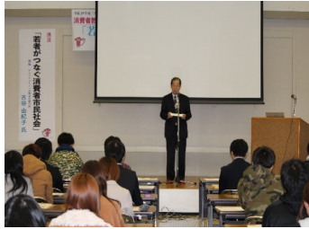
写真5 学長あいさつ