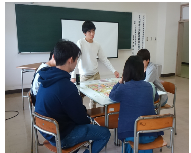
写真11 ライフサイクルゲーム挑戦

また、広報啓発のため、NPO法人青森県消費者協会から提供いただいた景品のうち、写真12のようにティッシュペーパーには青森県消費生活センターのQRコードをつけた紙を挿入し配布したところ、受け取った来場者は昨年より増えた。