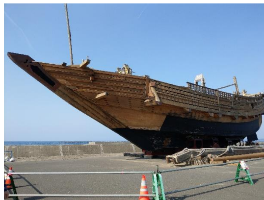
図 2 陸揚げされた「みちのく丸」

なお、みちのく丸は、2018 年 4 月に青森市から野辺地町へ輸送され、常夜燈公園の隣接地に陸揚げされた。陸揚げ後のみちのく丸の写真を図 2 に示す。陸揚げ作業は、2018 年 4 月 27 日、青森市の造船会社・北浜造船鉄工で下架（造船所の架台から降ろすこと）を行い、28 日には青森市から野辺地漁港まで海上輸送を行った。29 日には、常夜燈公園の隣接地に重さ 500 トンまでつり上げられる巨大クレーンを用いて陸揚げされた。