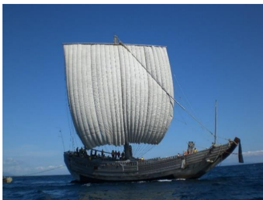
図 1 復元北前型弁才船「みちのく丸」

みちのく丸とは、財団法人みちのく北方漁船博物館財団によって建造された北前型弁才船の復元船であり、2014 年 3 月 31 日に野辺地町に無償譲渡されている。みちのく丸の全景を図 1 に示す。みちのく丸は日本古来の和船の建造技術や北前船の歴史、文化を後世に伝えるために建造されている。なお、北前船とは大阪から北海道まで日本海沿岸に寄港しながら売り買いを行った商船のことであり、当時の船は現存していない。また、弁才船とは船型の一つであり、江戸時代後期から明治 40 年代まで活躍し、千石の米を積むことが出来たために千石船とも呼ばれている。みちのく丸の船体構造はほとんどが明治初期に用いられた様式に忠実に復元されているが、自力帆走を目的に建造されたため、一部には航海に耐えられるよう現代の技術が用いられている。主要目は全長 32.0 m、全幅 8.5 m、深さ 3.0 m、帆柱までの高さ 28.0 m、千石積（積載重量 150 t）、一石＝米一俵（150 kg）である。