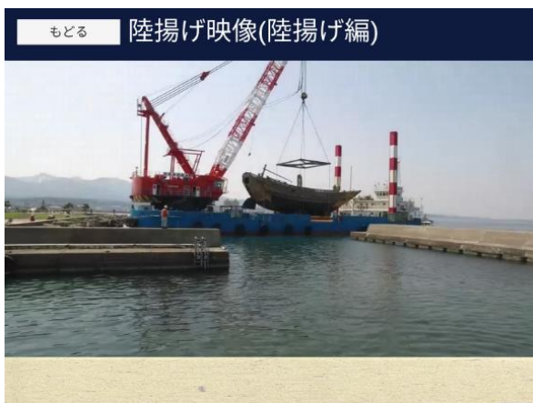
図6 みちのく丸関係の追加コンテンツ