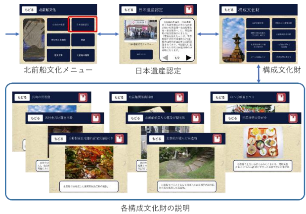
図7 日本遺産関係の追加コンテンツ