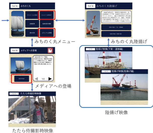
図5 みちのく丸関係の追加コンテンツ

コンテンツ、橙色が追加・変更を行ったコンテンツである。追加したコンテンツは大きく二つに分けられ、一つ目は陸揚げ関係、二つ目は日本遺産認定関係のコンテンツである。一つ目の陸揚げ関係のコンテンツは、図5に示すようにメインメニューの「みちのく丸」を選択し、「みちのく丸陸揚げ」を選ぶことによって利用することができる。このコンテンツには「陸揚げ映像(下架・運搬編)」と「陸揚げ映像(陸揚げ編)」の映像が含まれている。例として、「陸揚げ映像(陸揚げ編)」の画像を図6に示す。また、みちのく丸関係として、映画「たたら侍」のメイキング映像も視聴できるようにしている。これによって、これまで場所を変えて視聴していた陸揚げ映像などを船上で視聴できるようになると思われる。二つ目の日本遺産関係のコンテンツは、図7に示すようにメインメニューの「北前船文化」から「日本遺産認定」を選択することで利用することができる。追加コンテンツは、日本遺産認定の概要についての他に、認定された各構成文化財に関するページも準備する予定である。